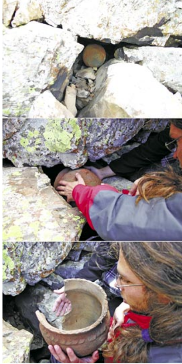
Recuperació d'una olla de l'Edat del bronze (aproximadament 1500 aC) a la vall de Llacs.

Un segon element que ha posat sobre la taula la recerca arqueològica és la profunditat temporal del registre arqueològic. Hom podria penar, d'entrada, que les restes arqueològiques identificades al Parc Nacional són bàsicament tancats i cabanes de pastor de "fa quatre dies"; és a dir, dels darrers segles. De fet, és una temptació associar els vestigis arquitectònics documentats al llarg de tot el Parc Nacional a les fotografies en blanc i negre d'etnògrafs de finals del s. XIX i la primera meitat del s. XX. Junt a les prospeccions de superfície en alguns jaciments s'hi ha realitzat petites cales estratigràfiques a fi d'avaluar el seu potencial arqueològic i recuperar materials que ens permetessin situar-los en el temps. Més de 80 datacions de Carboni 14 (C14) en una trentena de jaciments han dibuixat una llarga seqüència d'ocupació humana al Parc Nacional de més de 10.000